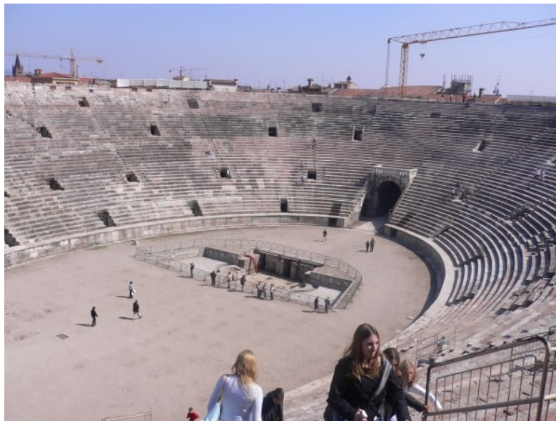
Arènes de Vérone