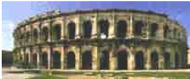
Arène de Nîmes