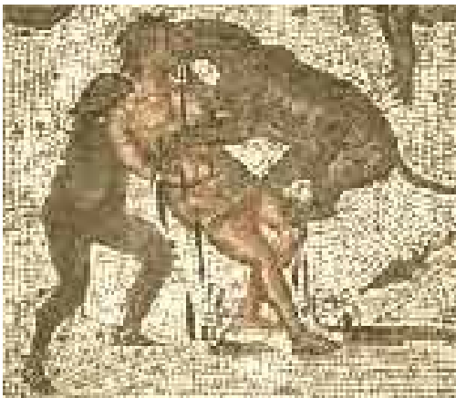
Homme se faisant dévorer par une bête sauvage lors de jeux du cirque

Les animaux qui combattaient étaient des taureaux, des ours, des sangliers ou encore des molosses spécialement dressés. Les bestiari (hommes qui combattaient les bêtes) étaient considérés comme la plus basse catégorie des combattants : ils permettaient d'achever les condamnés à mort. Les gladiateurs qui affrontent l'animal au corps-à-corps sont armés d'un pieu renforcé d'une pointe de fer ou d'une lance, et sont vêtus d'une simple tunique sans armure. Les animaux étaient ainsi massacrés en grand nombre : 9000 seront tués lors de l'inauguration du Colisée. Pour ramener les bêtes, des chasseurs expérimentés étaient mobilisés dans tout l'Empire et les légions comportaient même parfois des unités spécialisées. Pour neutraliser l'odeur des bêtes, des brûle-parfums sont répartis dans les arènes et les esclaves vaporisent des suaves effluves sur les notables.