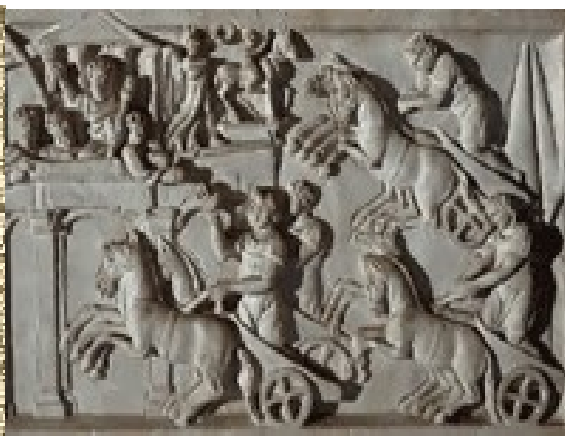
Relief représentant une course de chars au Circus Maximus (détail d'un sarcophage du IIIe s)

(Mosaïque romaine du IIe s av. J-C, musée archéologique, El Djem, Tunisie)