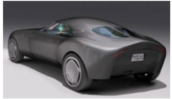
La voiture expérimentale hybride hydraulique LH4 de Lightning Hybrids

La société Lightning Hybrids , fondée en 2008, développe présentement une voiture expérimentale hybride hydraulique très légère (fibres de carbone), la LH4, qui devrait être prête en 2010 et avoir une consommation de biodiesel inférieure à 2,3 litres / 100 km, tout en affichant les performances d'une voiture sport. L'accélération anticipée pour passer de 0 à 100 km/h est de 5,9 secondes.