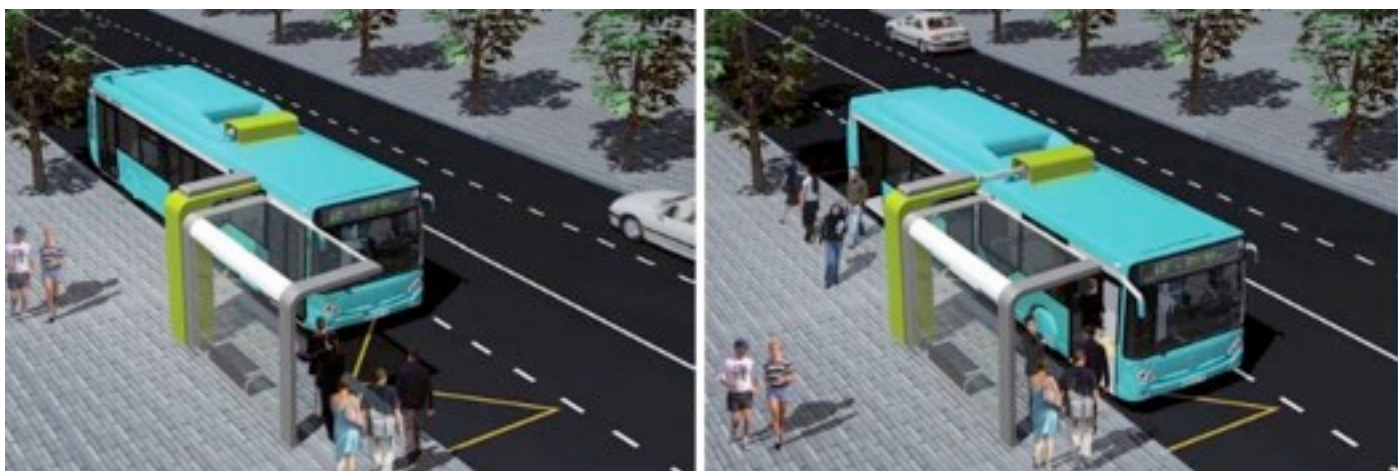
Illustration du projet WATT de PVI pour développer un système d'autobus biberonnés en France pour 2011.

Par ailleurs, je recommande au gouvernement québécois d'initier un projet d'autobus biberonnés qui utiliseraient les superbatteries au titanate de lithium développées à l'IREQ (Institut de recherche d'Hydro-Québec) par l'équipe du Dr Karim Zaghib. Car ces batteries à haute puissance semblent pouvoir subir 100 000 cycles de recharges profondes très rapides (voir les résultats présentés dans le numéro 4 de Transport 21 ).