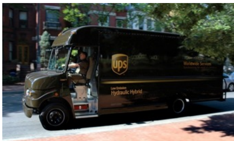
Un camion de livraison UPS transformé en hybride hydraulique, en 2006, par l'EPA et ses partenaires, dont UPS et Eaton corporation.

Les appels de puissance pour accélérer le véhicule sont gérés par la batterie qui débite plus de