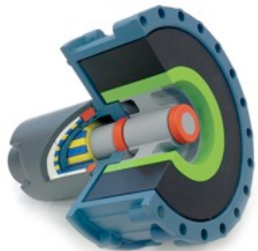
Le système Kinergy de Ricardo

Ce système doit être installé prochainement dans un autobus, le Flybus, où il sera attaché mécaniquement à une transmission Torotrak à variation conti-