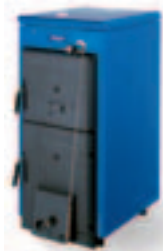
Logano G211 D disponible en cinq puissances

La chaudière robuste Logano G211D a le sens des priorités. Elle s'intègre et s'installe facilement dans votre installation de chauffage existante. Le compartiment de remplissage et le foyer, de grandes dimensions et facilement accessibles, assurent une utilisation simple. Outre sa robustesse, la Logano G211D en fonte, c'est la garantie d'une chaleur agréable, hiver après hiver.